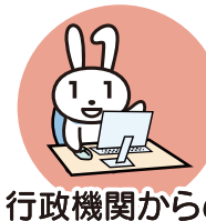
行政機関からの お知らせ・各種証明書