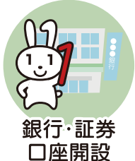
銀行・証券 口座開設