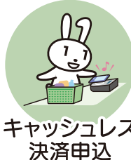
キャッシュレス 決済申込