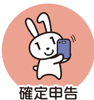
確定申告 (2024年度より)